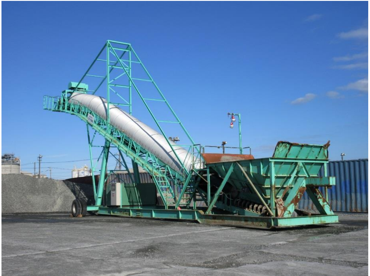
使用していた移動式コンベア 野積みされているのはかんらん岩