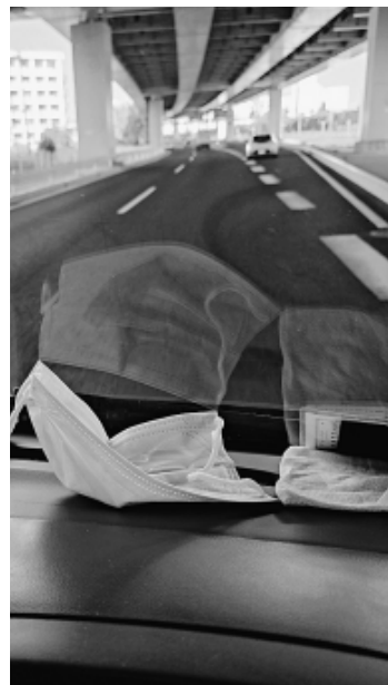
左レーンから追い越し、右レーンへ